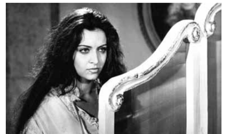
«Qızıl uçurum» filmindən fraqment

sahələrində elektrocihaz və elektrik dövrəsinin montajı, istisman və ona qulluq edən şəxs (peşə); 24.On bir dildə nəşr edilən Azərbaycan jurnalı; 25.Müasir təyyarə, vertolyot, raket və mərmirlərin uçuşunu avtomatik idarə edən cihaz və proqram-aparat kompleksi.