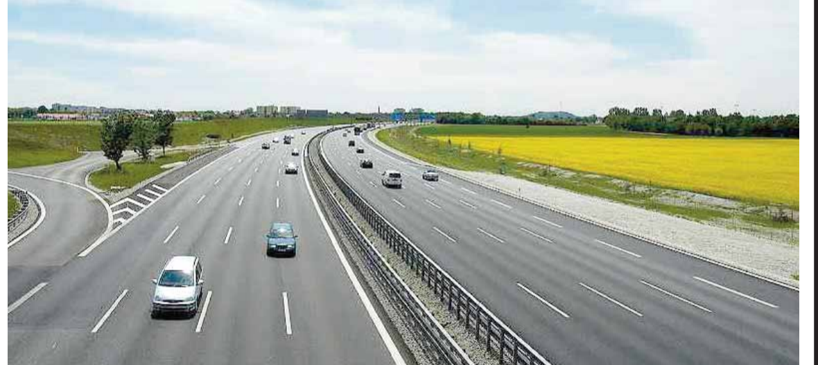
Rubrika üçün materialları Vergi siyasəti və strateji araşdırmalar Baş İdarəsi təqdim edib

ley (100 ley = 5,49 ABŞ dolları) gəlir gətirəcək. Gözlənilməsinə görə, bu vəsaitin böyük bir hissəsi (296 milyon ley) avtomobil yollarından istifadə üçün ödəmələrin artımı hesabına yığılacaq. 50 milyon ley sürücülər tərəfindən yol buraxılışlarının əldə edilməsindən, 9 milyon ley Moldova ərazisi vasitəsilə beynəlxalq daşınmalara verilən icazələrdən, 15 milyon ley isə digər yol yığımlarından daxil olacaq.