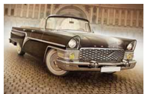
Az sayda istehsal olunan sovet avtomobili

anası; 18.Beynəlxalq foto agentliyi; 20.Üzərində silahlı adam şəklində olan kart; 21.Azərbaycanın məşhur gülüş ustası. «Nəsrəddin Xocanın 12 məzarı» bədii filmində (1966) baş rolun ifaçısının adı. Soldan sağa: 1.Gözlə görünməyən obyektlərə baxmaq üçün böyüdücü şüşələr sistemi olan optik cihaz; 5.Ud tipli alətlər qrupuna daxil olan qədim simli çalğı aləti; 7.Hər hansı mənbədəki işığın gücünü müəyyən etmək üçün cihaz; 8.Şəfqətli, mehriban, meyl edən, sevən, bəyənən; 10.Azərbaycandan görünən ekvatorial bürc; 11.Böyük Britaniyada şəhər; 12.Ensi, dərin, yamacları dik və qayalıq dəniz kərfəzi; 14.Sovet vaxtında az sayda istehsal olunan QAZ-13 representativ avtomobilin adı; 19.Azərbaycan Respublikasının əməkdar rəssamı, Naxçıvan Rəssamlar Birliyinin sədrinin adı; 21.Cinayətkarlar, quldurlar dəstəsi; 22.Elektrik