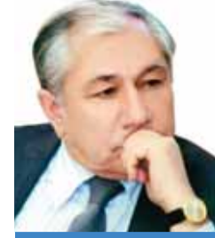
Akif Musayev Azərbaycan Respublikası vergilər nazirinin müşaviri