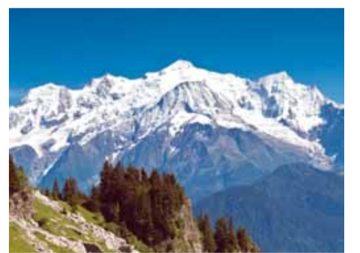
Alp dağ sisteminə daxil kristal massiv

Yuxarıdan aşağı: 1.Rusiya Federasiyasının paytaxtı; 2.Kimyəvi element; 3.Meksikada bələdiyyə; 4.Qabaqcadan hazırlanmış suallara cavab almaq üçün sorğu vərəqəsi; 5.Fiqurlu konkisürmədə ən sadə tullanma; 6.Döyüş əməliyyatlarının aparılması və yerləyişmə üçün minik atlarından istifadə edilən qoşun növü; 9.Kişi adı; 13.İtaliya bəstəkarı Cüzeppe Verdinin populyar opera əsəri; 15.Tərcümədə «ağ dağ» mənasını verən kristal massiv - Alp dağ sisteminə daxil olan Qərbi Alp dağlarında yerləşir; 16.Şərqdə ilk opera («Gəlin qayası») yazan bəstəkar qadın. Azərbaycanın xalq artisti, populyar mahnı və romansların, operetta və pyeslərin müəllifinin adı; 17.Hollivud ulduzu, ABŞ-ın Kaliforniya ştatının keçmiş qubernatorunun adı; 18.Qədim Misir mifologiyasına görə qoruyucu tanrı (başı insan, bədəni şir); 20.Açıq, aşkar, gözlə görünən, göz qabağında olan; 21.Sibir və Kazan xanı (1496-1497). Soldan sağa: 1.Dağıstan Respublikasının paytaxtı; 5.Rusiya Federasiyasının Perm vilayəti ərazisində çay; 7.Yunanıstanın ikinci böyük şəhəri; 8.Yanma zamanı çıxan od; 10.Rusiya Federasiyasının Sverdlovsk vilayəti ərazisində çay; 11.Abşeron ərazisində yerləşən, bütün Şərqdə nadir gözəlliyi ilə diqqəti cəlb edən, yaşı bir əsrdən çox olan məscid; 12.Türk mifologiyasında od tanrısı (xan); 14.Moskvanın mərkəzində tarixi kompleks; 19.Kişi adı; 21.Yazıçı, nasir, türüməçi, geologiya-mineralogiya elmləri namizədi (1942), dosent, əməkdar mədəniyyət xadimi. «Firtın», «Zirvələrdə», «Dalğalar qoynunda» və