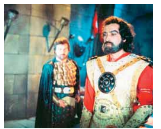
«Babək» filmindən epizod (1979)

başqa hər hansı digər fikri qəbul etməməsi; 8.Təsərrüfat subyektlərində müqavilə əsasında maliyyə-təsərrüfat fəaliyyəti sahəsində yoxlama, ekspertiza, təhlil, mühasibat uçotu aparən şəxs; 9.Musiqi türünü. Zil kişi səsi; 10.Alkənlər sinfindən doymuş karbohidrogen; 11.İlisu sultanı; 12.«Babək» filmində (1979) Babək əl-Xürrəmi obrazını ifa edən aktyorun adı; 14.Respublikamızda ictimai-siyasi qəzet; 19.Tarınnın mahiyyətini dərk etməyə və dünyadakı məxluqların, o cümlədən insanın var olmasının səbəbini anlamağa çalışan yəhudiliyə məxsus mistik ənənə, təlim; 21.Hindistanda və Şərqi bəzi ölkələrində ata-baba peşələri və hüquqi vəziyyətləri cəhətdən bir-biri ilə bağlı olan qapalı ictimai qrup, təbəqə; 22.Xaşxəşkimilər fəsiləsinə aid bitki cinsi. Qadın adı. Azərbaycan klassik ədəbiyyatında ayrı-ayrılıqda qeyd edilən müxtəlif qadın obrazları.