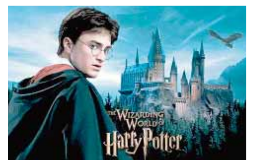
Dünyanın 65-dən çox dilinə tərcümə edilən roman və onun əsasında çəkilən «Harri Potter» filmlər seriyası

dim yunan mifologiyasında məşhur təbib, təbabət tanrısı Asklepin və Epionun oğlu; 20. Avstriyanın cənub-şərqində şəhər; 21. Hindistanın şimal-qərbində şəhər. Soldan sağa: 1. 1466-1554-ci illər arasında hökm sürmüş xanlıq; 5. Qohumluq dərəcəsi; 7. Hər hansı müqavilədə (xüsusilə beynəlxalq müqavilələrdə) və müvəqqəti şərəitdə dəyişməsi ehtimalı böyük olan hallarla bağlı müqavilələrdə, məsələn, sığorta müqaviləsində) edilən müəyyən qeydlər və düzəlişlər; 8. Açıma, anlatma, izah, təfsir, bildirmə; 10. Hövsələ, səbir, həvəs, mərifət; 11. Elmi dinə tabe etməyə, elmi biliklərdən dini ehkamların müdafiəsində istifadəyə çalışın təlim; 12. Suyun qaz vəziyyəti; 14. Müəyyən məsafə üzrə idman yarışlarının başlanma anı; 19. Türk və altay xalq mədəniyyətində yeni ilin başlanğıcı; 21. Kəmərsiz geniş köynək şəklinde kişi iş paltarı; 22. Azərbaycanın milli yeməyi; 23. Sığorta hadisəsi baş verdiyi za-