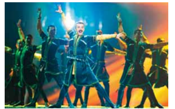
Azərbaycanın milli hərbi rəqsi

Yuxarıdan aşağı: 1.Amerikada məskunlaşmış qriflər sinfinə aid quş; 2.Teatr və kino sahəsində böyük uğurlar qazanmış, Azərbaycanın xalq artisti adına layiq görülmüş mərhum aktrisanın adı; 3.Şpatelə oxşar trafaret çap maşınlarında element; 4.Rusiya Federasiyasının Altay Respublikası ərazisində ən hündür dağ silsiləsi; 5.Əhəng əsaslı təbii üzlük daşı; 6.«Hobbit və ya oraya və geriyyə» povestinin, «Üzükənlərin hökmdarı» romanının müəllifi kimi məşhurlaşmış ingilis yazıçısı, linqvisti və filoloqunun soyadı; 9.Məqsəd, arzu, ümid, dilək; 13.Azərbaycanda, İran və Türkiyənin bir sıra bölgələrində uzunsov böyük xovlu xalçalara verilən ad; 15.Qarıxıq, müxtəliflik; 16.Şumer və akkad mifologiyasında Babil panteonunun, Mesopotamiyanın ali tanrısı; 17.Polimer istehsalında istifadə olunan kimyəvi maddə; 18.Çində ənənəvi zərb musiqi aləti; 20.Abreron rayonunda qəsəbə; 21.Rusiya Federasiyasının Murmansk vilayətində çay. Həminin, yundan toxunulmuş qadın üst geyimi. Soldan sağa: 1.Simli musiqi aləti; 5.Şahidlərin iştirakı ilə yoxlama nəticəsində müəyyən edilən bir faktı təsdiq edən sənəd, protokol; 7.Kabardin-Balkar Respublikasında şəhər; 8.Əmək qabiliyyətini itirmiş şəxs; 10.Rusiyada şəhər; 11.İran İslam Respublikasının birinci dini lideri və qurucusu; 12.Azərbaycanın milli hərbi rəqsi; 14.«Təxribat» filminin qəhrəmanı Zaur obrazını canlandıran aktyorun adı; 19.Gədəbəy rayonunda kənd; 21.Hindistanda və Şərqi bəzi ölkələrində ata-baba pəşələri və hü-