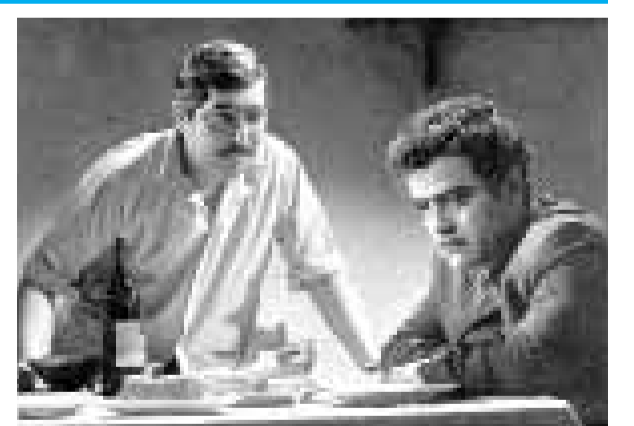
«Bir cənub şəhərində» filmindən epizod

keçirici cihaz; 8. İctimai nəqliyyat növü; 9. Qıpçaq əsilli Qızıl Orda sərkərdəsi; 10. Yunanıstanın cənub-qərbində şəhər; 11. İsveçrənin cənub-qərbində şəhər; 12. Azərbaycan kinorejissoru, ssenaristi, Azərbaycan SSR Dövlət mükafatı laureatı (1978), Azərbaycanın xalq artisti. «Bir cənub şəhərində», «Babək», «Nizami» kimi populyar filmlərin rejissorunun adı; 14. Heyvan növü; 19. Orta əsrlərdə Avropada əmlakın (əsas etibarı ilə torpaq mülkiyyətinin) yalnız böyük oğula, ya da nəslin ağsaqqalına keçməsi haqqında varislik qaydası; 21. Təminat və ya müdafiə məqsədi ilə üz geyinilən əşya; 22. RF-nin Yaroslavl vilayətində çay; 23. Mübahisə, müzakirə, disput və s.