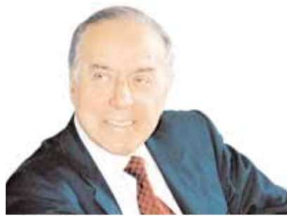
Biz bazar iqtisadiyyatını vergi yolu ilə tənzimləməliyik.